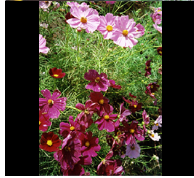
晴れる日は、カメラを持って散歩することも。近所のお花をパチリ！