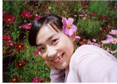
2004年10月の撮影で山梨のコスモス畑に行きました☆花を撮るのは大好き！