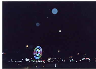
雨のお台場。レンズに雫がついてとてもロマンチックでしょ？

お弁当とか、何を撮っているの？ っていうものもあるんだけど、そのときはお弁当に感動して撮っていたはずだから、きつつまらないことにもいっぱい魅力があるんです。そういうつまらないことって忘れてしまいうけど、それを撮っておいたから今思い出せるでしょ。それがすごい、自分に感謝っていうか、えらい、えらいなって感じですよ。