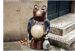
「変な奴」公園や道端で見つけた変な奴ら。