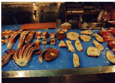
市場で遭遇した解体後の巨大タコ。