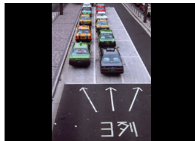
以前渋谷にあったというタクシー乗り場。