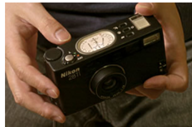
上部についているのがアナログの表示。 左手の指しゆびあたりについているのが スライド式のスピードライト切り替えボタンだ。

僕、コンパクトカメラの望遠レンズがあまり好きではないんですよ。ギューンってレンズが伸びるのが嫌で。これは単体で出てくるだけだから、それも好きなんです。全体の形も四角っぽくて、余計なでっぱりがないのもいい。見た目も好きなので、持っていてうれしい、という感じのカメラですね。