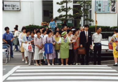
「子供のかたまり、おばさんのかたまり」