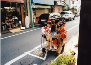
「子供のかたまり、おばさんのかたまり」