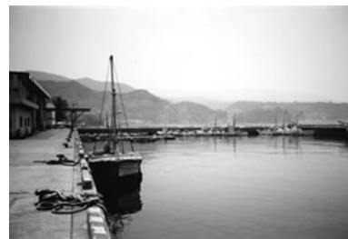
「いえいえ、ここ最近の景色です」

そうだと思います。静止画は時間がそこで止ってるから、創造しやすい、頭がよく回る。映像は映像の素晴らしさがありますけど、時間は止められないんですよ。30分の映像なら30分、その映像通りのスピードに頭がなっちゃいますけど、写真はそこから戻ろうが、一気に進めようが自由ですもんね。アルバムなんてまさにそうですね。一枚の写真にどれだけ時間をかけようが、自分のスピードで次のページをめくれますからね、それは素敵なことですよ。