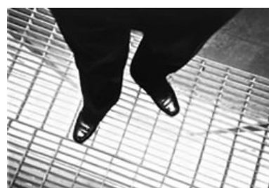
「足元見失わぬように！」

そうですね。やった、この仕事を勝ち取ったとか、週にレギュラー一本だとか、そういうのはないんですよ。たとえば今仕事が一とつしかなくても、それがすごく楽しい仕事だったら充実できるんです。もちろん楽しい仕事がたくさんあればそれにこしたことはないですけど、仕事に対する思いというか、そういうのはまったく変わってないですね。