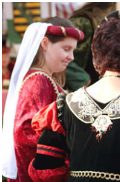
騎士ショーで撮影。肩ごしからさりげなく撮影されている。衣装の美しさと女性の笑顔が印象的な一枚。