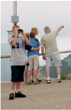
望遠鏡を覗く子供を撮影しようとしたら、うまい具合に後ろのお父さんが手を上げてくれたんだとか。

ですよ。本当に便利です。いろいろデジタルカメラは試したんですが、D1Hが一番好きですね。D1Hってあまりカメラ雑誌に取りあげられなかったりしていないように思うんです。不満ですよ。こんなにいいカメラなのに。