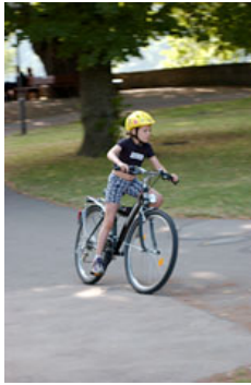
スピード感溢れる一枚。走ってくる自転車を待って、撮影するタイミングを測り、狙って撮影したようだ。