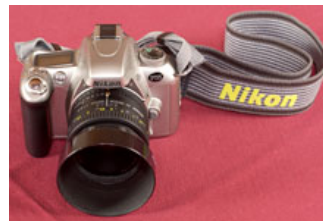
香港で購入したF55と50mm F1.8Dのレンズ。カメラの性能はもちろん、小ささ、軽さにも満足しているとか。

そうです。僕は50mmが出ると必ず買っちゃうんですよ。これは本当に最近買ったんです。早速使っていますが、すごくいいですよ。あと、レンズのふちが奥まっていますよね。このデザインも好きなんです。