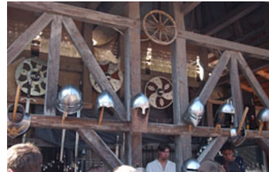
騎士ショーで撮影。城内で開かれていた武器屋さん。中世さながらの世界に先生も驚いたそうだ。

そうですね.....これだけ撮影してきていると、頭がいつでもカメラの事を考えるようになっていきますね。撮影とは関係なく、ただ道を歩いている時にも、この被写体なら何mmのレンズがいるなあ、なんて言ったりして。僕にとってカメラは体の一部ですね、もう。