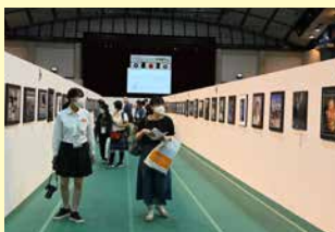
全国の高校生の傑作・力作も一挙展示。