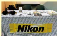
ニコンカメラやカタログを展示!