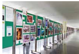
8月に埼玉県庁で行われた写真展では、学校単独で70点展示。

お近くの人、ぜひどうぞ! ~若き才能の萌芽~ 妻沼高校写真部作品展 9月7日(火)~12月5日(日)