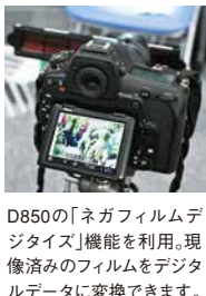
D850の「ネガフィルムデジタルサイズ」機能を利用。現像済みのフィルムをデジタルデータに変換できます。